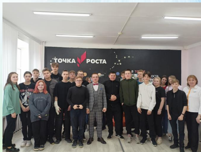
Участники дистанционной игры «Космическая одиссея» из Нагорской школы

3 место - команда 11 класса Нагорской школы «Новая звезда».