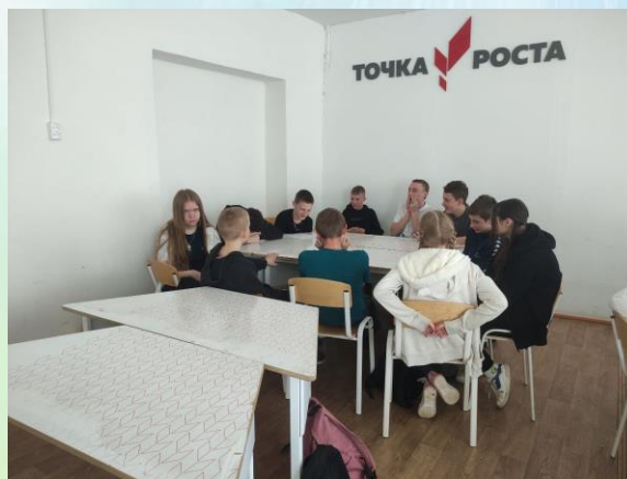
Игра «Экологические ходы» в 8 классах