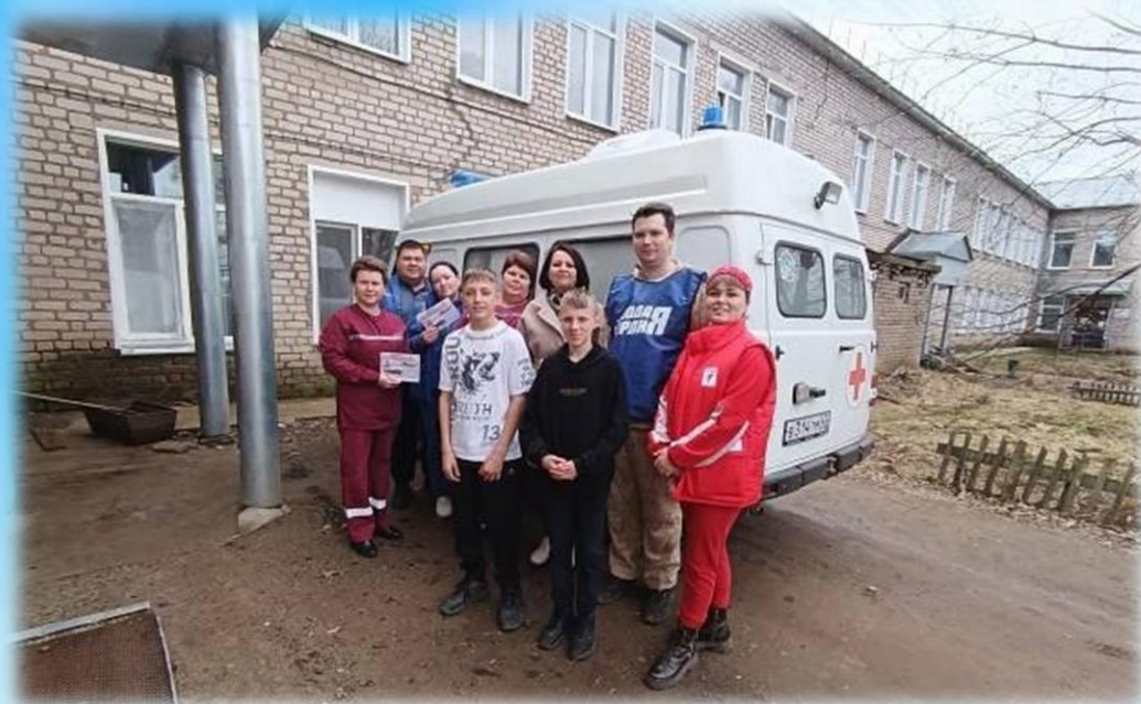
Всероссийская акция ко дню работника скорой помощи