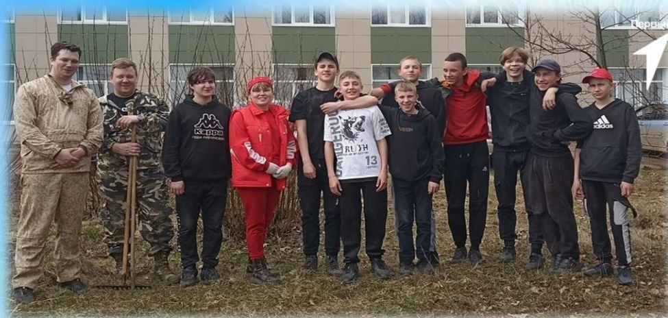
Участники акции «Юннатский субботник»

27 апреля в парке 80-летия Победы в рамках Всероссийской акции, посвященной дню Земли, прошёл «Юннатский субботник», который объединил усилия активистов Движения Первых средней школы поселка Нагорск, членов районного Совета молодежи и представителей Молодой Гвардии.