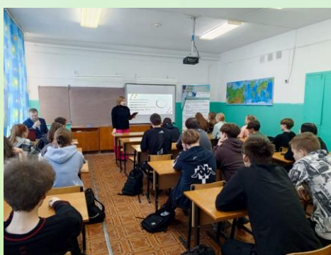
Профориентационная встреча обучающихся 9-ых классов с представителями Слободского колледжа педагогики и социальных отношений