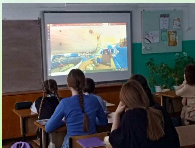
Виртуальная экскурсия в музеи авиации и космонавтики в 6 «а» классе

Обучающиеся 6 «а» класса посетили виртуальные экскурсии в музеи, где узнали много нового об истории развития авиации и космонавтики.