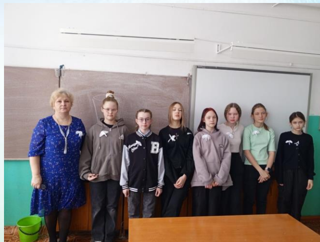
Разговоры о важном в 6 «а» классе, посвящённые памяти жертв теракта в «Крокус Сити Холле»

Также обучающиеся приняли участие в создании белых цветков Крокуса, которые поместили на грудь как символ траура о жертвах теракта в Крокус Сити Холле.