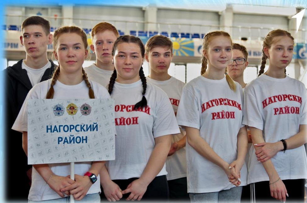
Команда Нагорского района на региональном этапе проекта «Вызов первых»

С 19 по 21 апреля в легкоатлетическом манеже спортивного комплекса «Вересники» прошел региональный этап Всероссийского проекта «Вызов первых».