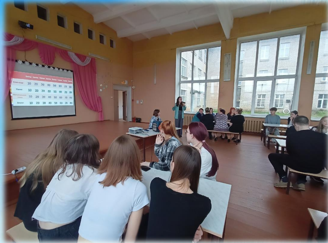
Интерактивная игра «Хочу как в кино!»

Насколько хорошо ученики и учителя нашей школы ориентируются в кинематографе? Именно это мы решили проверить!