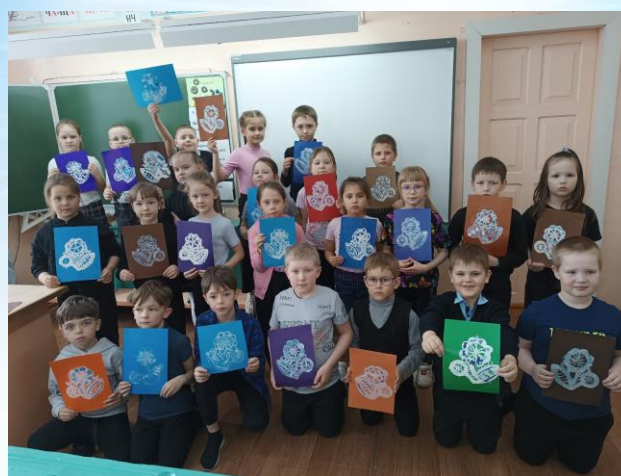
Урок «Дети и традиция» в 1 «б» классе

Для обучающихся 1 «б» и 5-х классов нашей школы прошёл творческий урок «Дети и традиция». Ученики узнали о народном промысле Вятского края – кукарском кружеве и выполнили творческое задание!