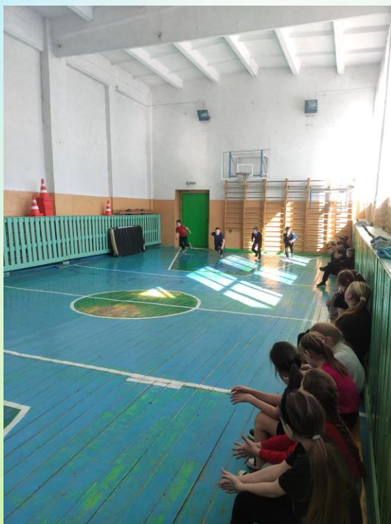
Спортивный забег в 4 «а» классе