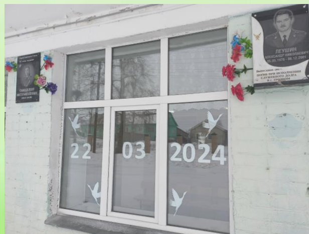
Акция «Окна памяти»

В рамках акции «Окна памяти», приуроченной к памяти о жертвах теракта в «Крокус Сити Холле», обучающиеся 9 «в» класса оформили окна школы белыми журавлями.