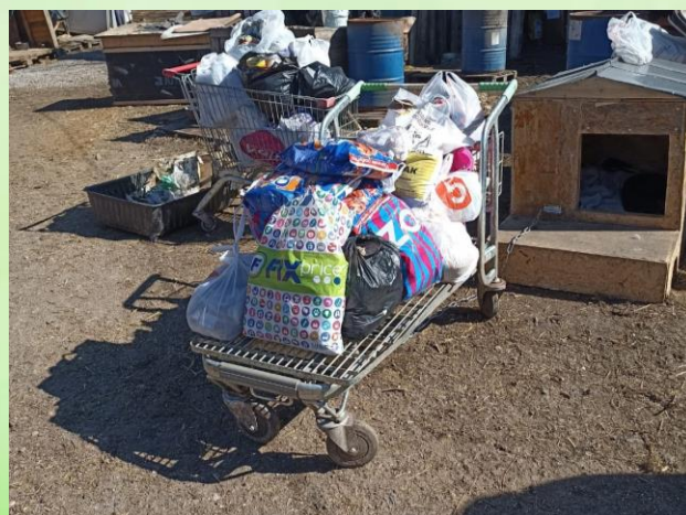
Корм, собранный школой в рамках акции «Дари Добро»

Выражаем огромную благодарность всем тем, кто принял участие в акции по сбору корма для животных «Дари Добро», а также помог в его сортировке и погрузке. Весь собранный корм передан в приют для животных г. Кирова «Мокрый нос».