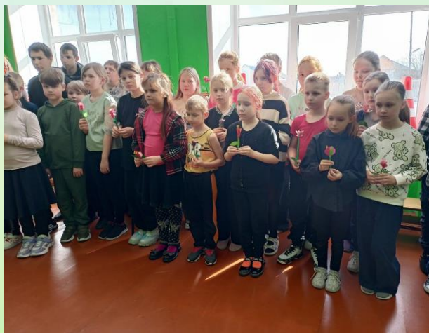
Акция «Свеча памяти»

В рамках акции «Окна памяти», приуроченной к памяти о жертвах теракта в «Крокус Сити Холле», обучающиеся 9 «в» класса оформили окна школы белыми журавлями.