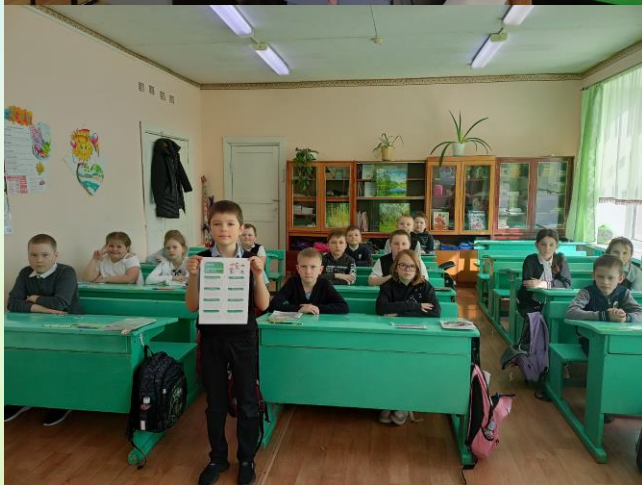
Акция «Здоровье в Движении»

Также в рамках Всемирного дня здоровья в школе были проведены уроки первой помощи, которые являются неотъемлемой частью образовательного процесса.