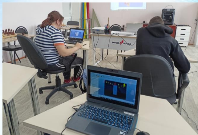
Урок «Мой космический аппарат» в 8 «в» классе

Для учеников 8 «в» класса прошёл урок «Мой космический аппарат». Ребята узнали о том, какие животные побывали в космосе, навели порядок в Солнечной системе, расположив планеты в правильном порядке, а также придумали схемы своих космических аппаратов!