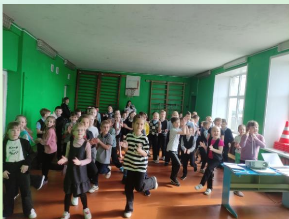
Посвящение в Орлята обучающихся первых классов