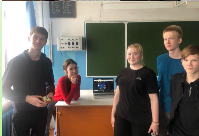
Команды участников игры «Космическая одиссея»

Игра состояла из 5 увлекательных туров: «Расшифруй», «Кто есть кто?», «Где логика?», «Интересные факты о космосе», «Космические песни».