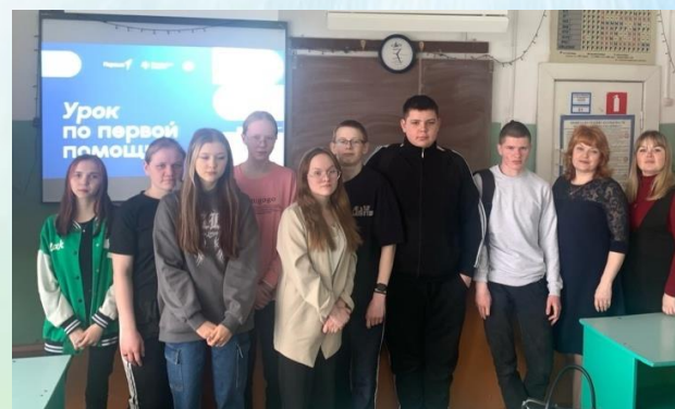
Урок первой помощи в 9 «а» классе

Умение правильно оказать первую помощь может спасти жизнь в критической ситуации. Важно помнить, что знания по первой помощи должны быть доступны каждому, ведь когда каждая минута имеет значение, умение действовать правильно может спасти чью-то жизнь.