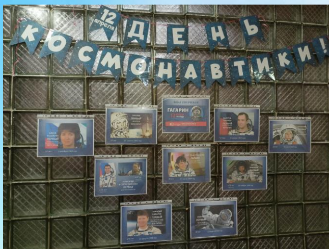
Праздничный стенд к Дню космонавтики

В школе был оформлен информационный стенд, посвящённый Дню космонавтики.