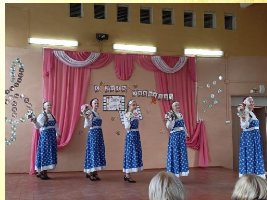
Праздничный концерт, посвящённый Дню Учителя

Дорогие учителя, вы сочетаете в себе мудрость и молодость души, креативность и огромную энергию, доброту и строгость! Ваш труд невероятно сложно оценить! От души поздравляем вас с профессиональным праздником! Любви вам, терпения, счастья и благополучия! Спасибо за ваш труд!