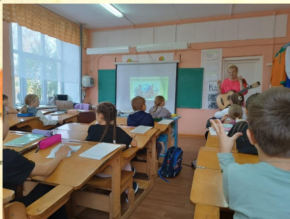
Экологический урок «Они нуждаются в защите»