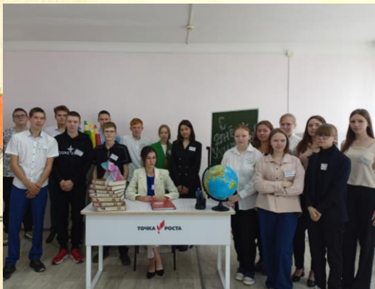
Ученики школы в день самоуправления

В этот день в роли учителей в нашей школе побывали старшеклассники. Ребята были в восторге от новой роли, но единодушно отметили, что быть учителем – тяжелая и ответственная работа, которая не каждому по плечу!