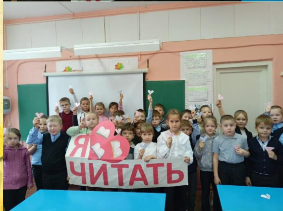
Игра-викторина «Библиоград» в 1-ых классах

20 октября празднуется Международный день Повара.