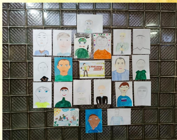
Конкурс рисунков «Мой папа – самый лучший»

В преддверии Дня Отца обучающиеся начальных классов приняли активное участие в выставке рисунков и фотографий «Мой папа – самый лучший».