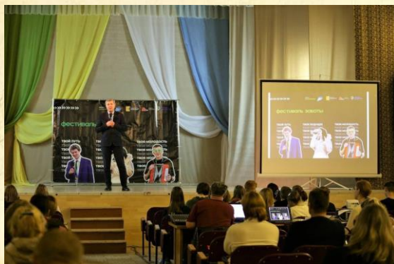
Торжественное открытие «Фестиваля заботы»

После торжественного открытия все гости были поделены на 3 группы, у каждой из них был свой маршрут.