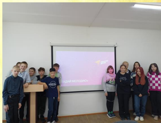
Музыкальная игра «Угадай мелодию» в 7 «б» классе