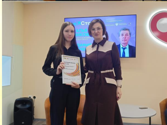
Награждение активистов Нагорской школы за помощь в проведении фестиваля здорового образа жизни