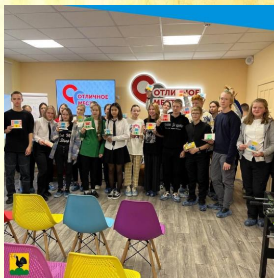
Мастер-класс по созданию открыток для учителей

Пока учителя и педагоги находились на образовательных лекциях, для школьников был проведен мастер-класс по созданию открыток для учителей.