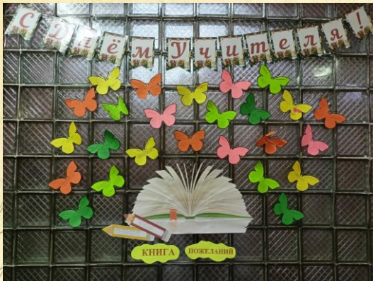
Стенд с поздравлениями учителям от учеников школы

День учителя – один из самых известных, любимых профессиональных праздников. Традиционными для этого дня являются «море» цветов, поздравления педагогов, обещания со стороны учеников радовать успехами!