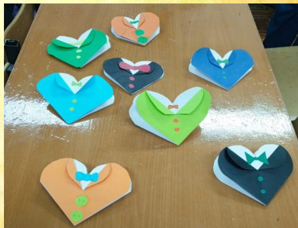
Поздравительные открытки для отцов

Также ученики школы поучаствовали в создании поздравительных открыток для своих пап.