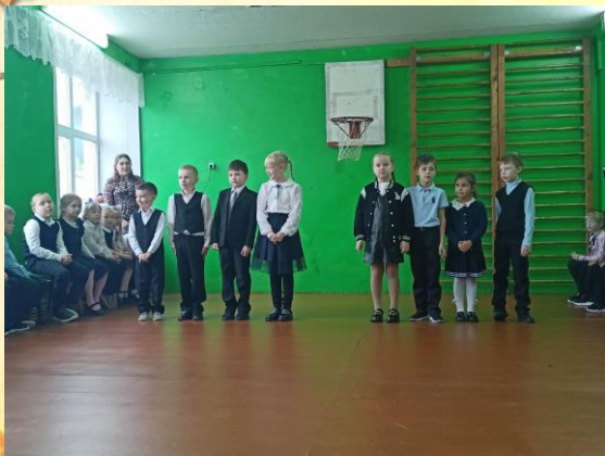
Первоклассники читают стихотворения

Ребятам на мероприятии предстояло выполнить несколько заданий: решить интересные задачки, отгадать загадки, выполнить определённые движения под музыку, прочитать стихотворения перед одноклассниками. Со всеми испытаниями первоклассники справились на «отлично». Все присутствующие на празднике убедились – в школу пришли талантливые дети!