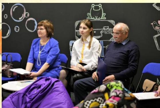
Семинар – практикум по профилактике эмоционального выгорания

Учителя посетили семинар – практикум по профилактике эмоционального выгорания. На нем они узнали, как эффективно управлять стрессом и адаптироваться к нагрузкам, связанным с педагогической деятельностью.