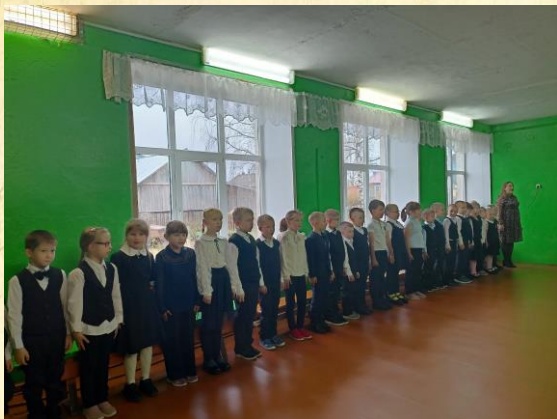
Исполнение гимна Российской Федерации на посвящении в первоклассники

16 октября у обучающихся первых классов прошёл праздник «Посвящение в первоклассники». Уже почти два месяца юные ученики знакомятся со школьной жизнью. За это время они многому научились, многое узнали. И вот настало время стать полноправными членами школьной семьи.