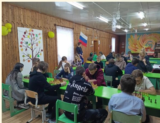
Участники турнира за игрой в шахматы

На шахматный турнир собрались команды из шести школ Нагорского района.