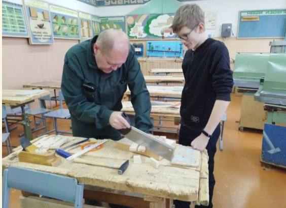
Профессиональная проба «Плотник, столяр»

Для девочек прошло практическое занятие «Лаборант химического анализа».