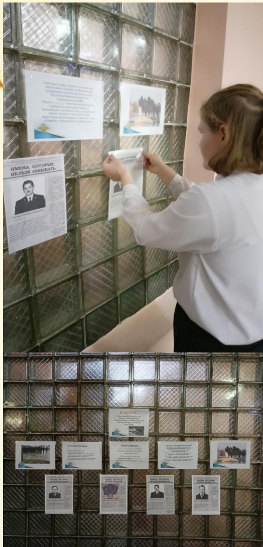
Стенд, посвящённый памяти героев, погибших при исполнении служебных обязанностей