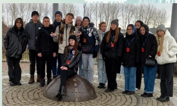
Делегация школьников из Кировской области в путешествии по «Императорскому маршруту»

Я считаю, что каждый человек обязан знать и помнить историю своей страны и такую поездку я запомню надолго!»