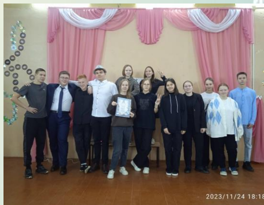
Обучающиеся 10 класса на станциях квеста