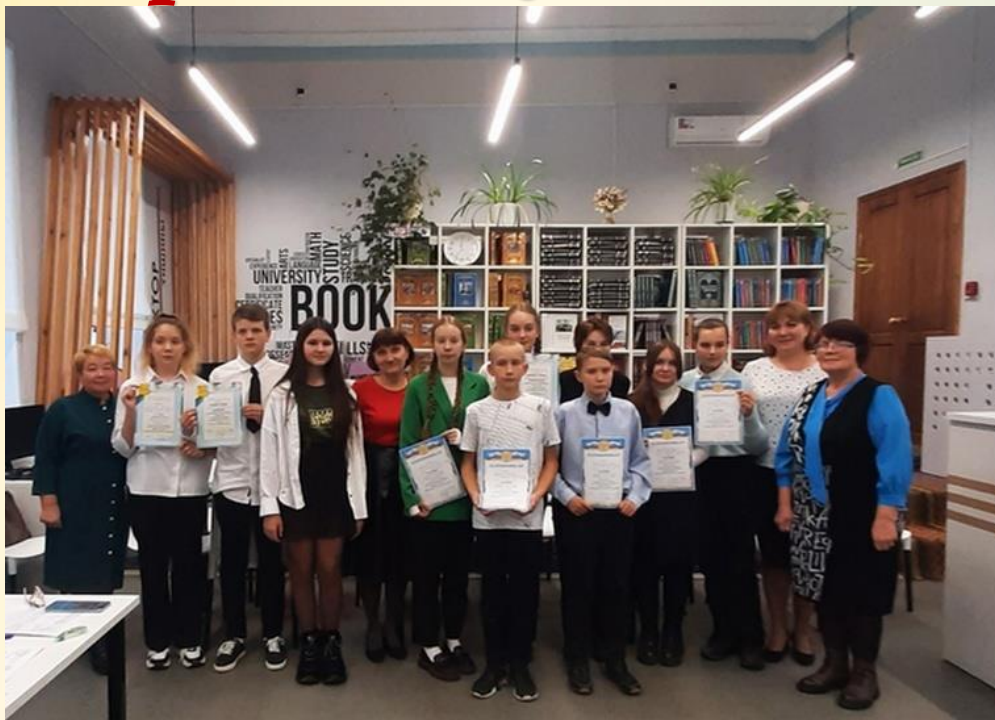
Участники районной встречи юных краеведов-книголюбов

1 ноября в центральной районной библиотеке состоялись районные встречи юных краеведов – книголюбов по теме «Высокий дар доброты» (Образ учителя в произведениях писателей-земляков).