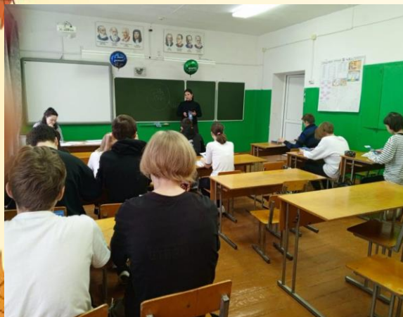
Профориентационная встреча с учениками 9 «б» класса

11 ноября представители Кировского филиала Московского финансово-юридического университета провели профориентационные встречи с обучающимися 9-11 классов.