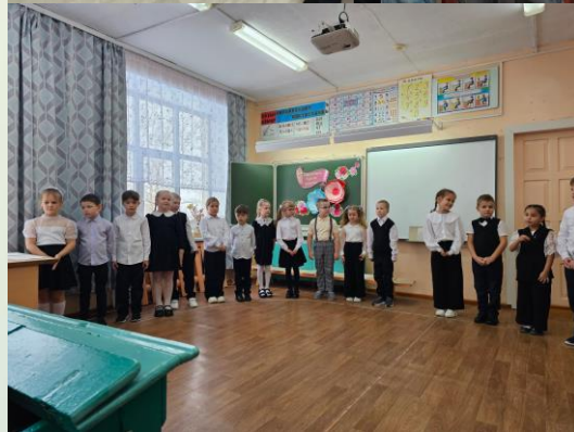
Подготовка учеников к Дню Матери

От всей души поздравляем всех мам и бабушек с самым нежным праздником!