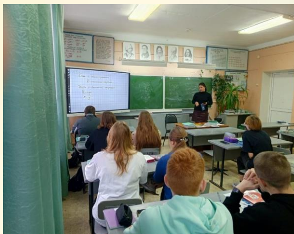
Профориентационная встреча с учениками 11 класса

Ученикам рассказали о направлениях подготовки студентов университета, а также об актуальных правилах поступления.