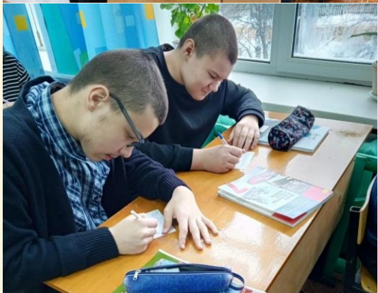
Акция «Письмо маме Первого»

Все обучающиеся школы совместно с учителями долго и усердно готовились к Дню Матери. Делали открытки, подарки, готовили творческие номера!