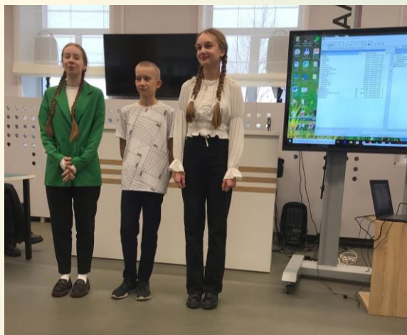
Участники встречи краеведов-книголюбов из Нагорской школы

В конкурсе приняли участие 10 обучающихся из школ пгт Нагорск, с. Синегорье, с. Мулино.