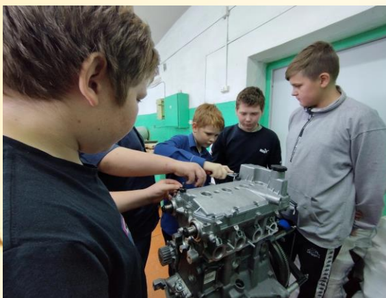
Профессиональная проба «Мастер по ремонту и обслуживанию автомобилей»

Мальчики посетили два профессиональных направления: «Мастер по ремонту и обслуживанию автомобилей», «Плотник, столяр».