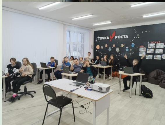
Обучающиеся пятых классов Нагорской школы на турнире по поиску информации в сети Интернет

С большим увлечением ребята соревновались в точности и скорости нахождения ответов на вопросы с помощью сети Интернет. Получили массу положительных эмоций и бесценный опыт!