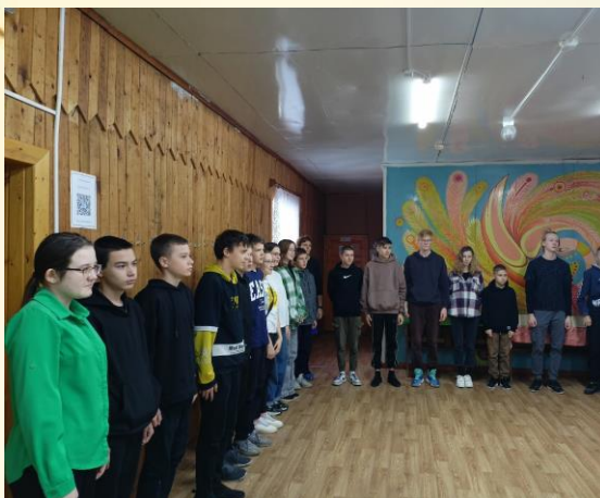
Построение перед началом соревнований

Командам – победительницам вручили медали и грамоты.