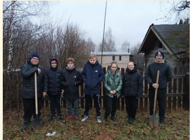
Посадка кедров около здания школы в честь памятной даты

Обучающиеся 9 «в» класса посадили в честь памятной даты около школы кедры.