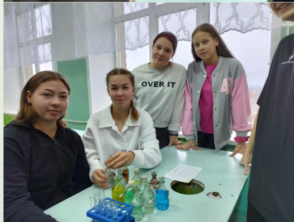
Профессиональная проба «Лаборант химического анализа»

Профессиональная проба является средством самоопределения обучающихся. Такой подход ориентирован на расширение границ понимания профессиональных функций и приобретение обучающимися опыта профессиональной деятельности.