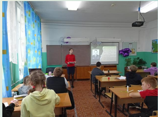
Музейный урок в 6 «а» классе