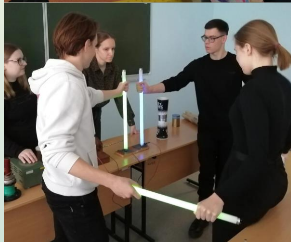
Обучающиеся на мастер-классе «Физика вокруг нас»