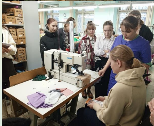
Ученицы Нагорской школы на экскурсии в швейный цех Клевер