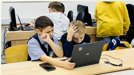
Участники турнира по поиску информации в сети Интернет Лицея №9 г. Слободской

В турнире 2023 года участвовали 51 команда, включая учеников Лицея № 9 и других образовательных учреждений Северного округа.