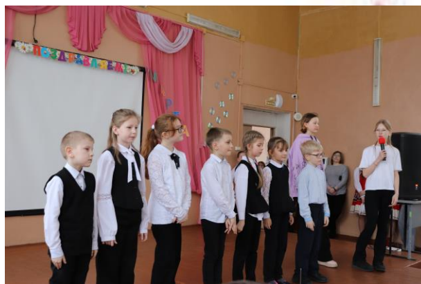
Творческие подарки от учеников школы