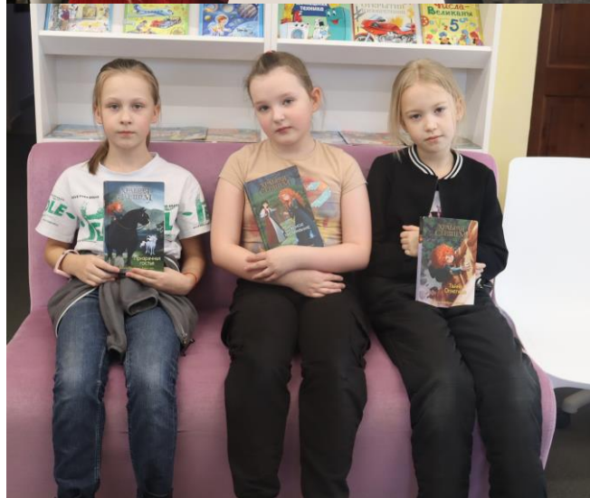
Ученики 3 «а» класса – постоянные гости библиотеки!