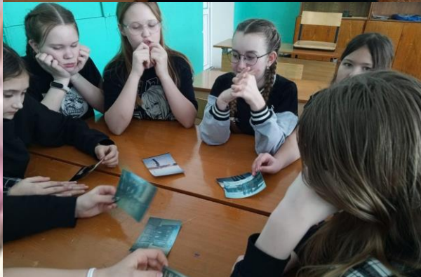
Урок мужества «Защитников Отечества семья» в 6 «а» классе

После встречи ученики в командах приняли участие в интеллектуальной игре «Морской бой».