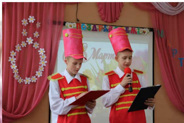
Ведущие праздничного концерта

Традиционно в честь праздника в нашей школе прошел концерт, посвящённый всем дамам! Для зрителей ученики подготовили танцевальные номера, музыкальные поздравления, стихи, сценки и самые добрые пожелания!