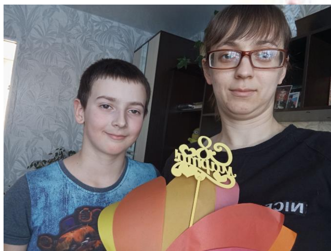
Цветы для самых любимых от учеников 3 «а» класса