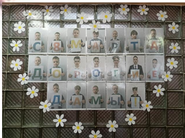
Праздничный стенд к 8 Марта!

Накануне Международного женского дня все мальчики школы поздравили учителей и девочек. В фойе школы был оформлен праздничный стенд.