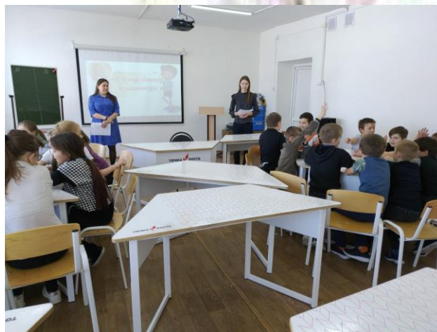
Игра «А ну-ка, девочки и мальчики!» в 4 «а» классе

Участникам понравились конкурсы, они с интересом выполняли задания и показывали свою смекалку, ловкость и находчивость.