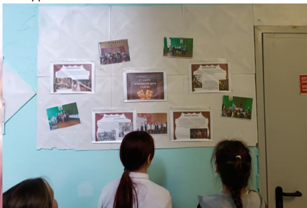
Стенд, посвящённый Всемирному дню театра

Также обучающиеся школы поучаствовали в онлайн-активности «Театральный этикет». В видеоролике они рассказали о том, как нужно правильно вести себя посетителям театра.