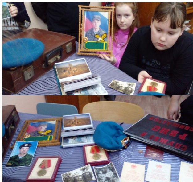
Классная встреча «Армейский чемоданчик» в 3 «а» классе

После семейных бесед, встретившись в своём классе, ученики поделились с одноклассниками рассказами о воинской службе своих родственников, показали друг другу предметы быта, связанные с воинской службой, хранящиеся в семейном «чемодане».