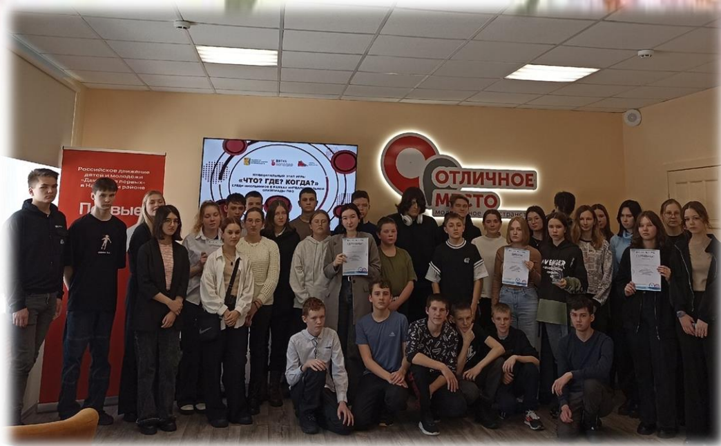
Участники муниципального этапа интеллектуальной олимпиады «Что? Где? Когда?»

5 марта в молодёжном пространстве «Отличное место» прошёл муниципальный этап интеллектуальной олимпиады Приволжского федерального округа «Что? Где? Когда?».