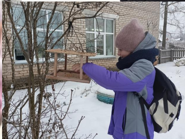
Школьная акция «Покормите птиц зимой»