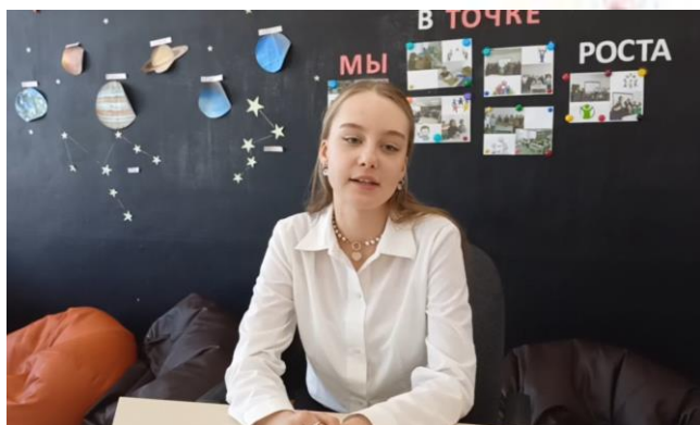
Онлайн-активность «Театральный этикет»