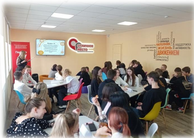
Команды участников олимпиады «Что? Где? Когда?»