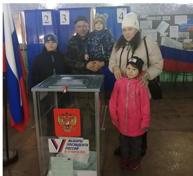
Ученики 3 «а» класса и их семьи на избирательных участках