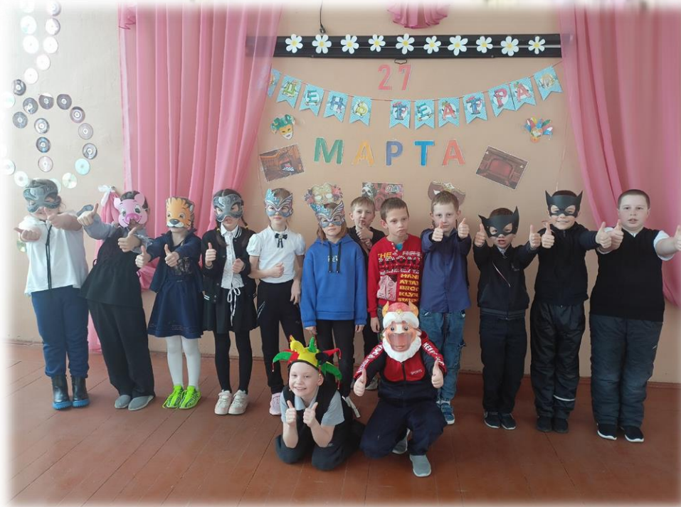
Всемирный день театра в нашей школе

27 марта - Всемирный день театра. Это праздник всех театральных деятелей и ценителей этого искусства.