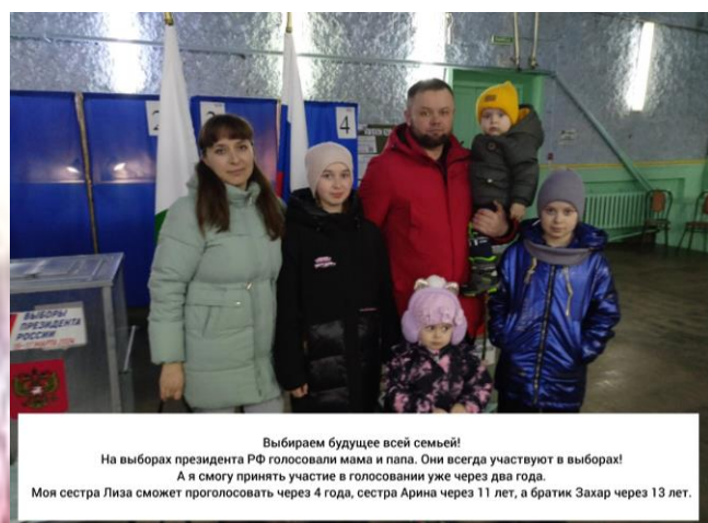
Календари будущих избирателей учеников 6 «а» класса

Ученики 3 «а» класса выполняя последнее задание проекта, вместе со своей семьей посетили избирательные участки, где сделали общие семейные фотографии. В социальной сети «ВКонтакте» ребята совместно с родителями и классным руководителем организовали целую фотовыставку и рассказали друг другу о традициях, которые существуют в такие дни в их семьях.