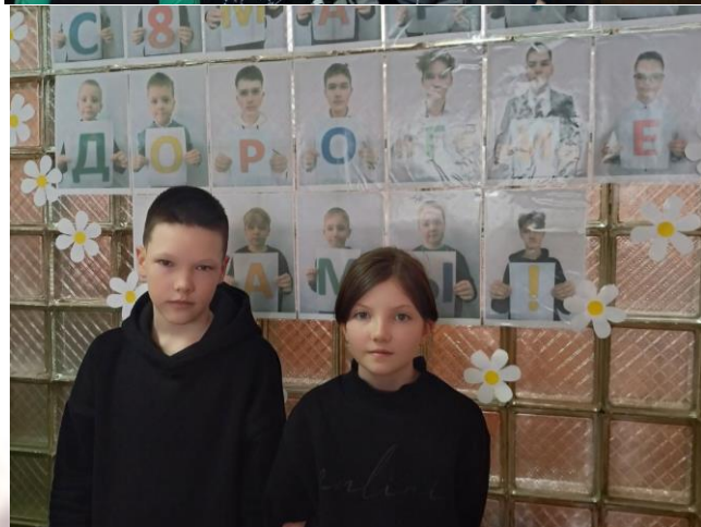
Праздничная фотосессия в 6 «а» классе

Обучающиеся 3 «а» класса самым милым и любимым мамам, бабушкам и сестрам подарили «Букет доброты» - цветы с добрыми пожеланиями и поздравлениями!