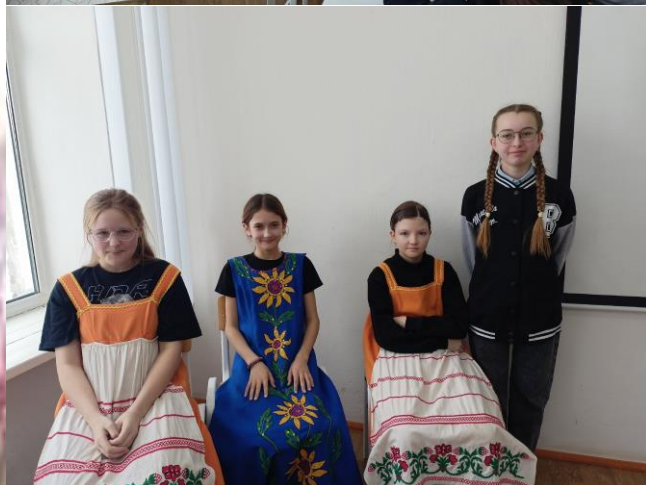
Вечер поэзии в 6 «а» классе

Ученики 3 «а» класса также успешно выполнили третье задание проекта.