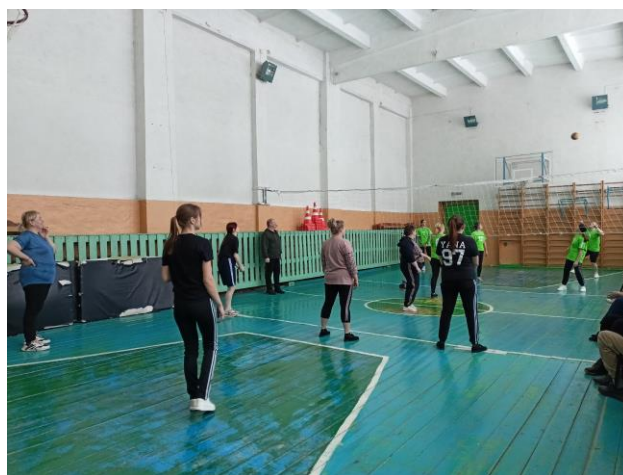
Соревнования по волейболу между командой учеников и учителей