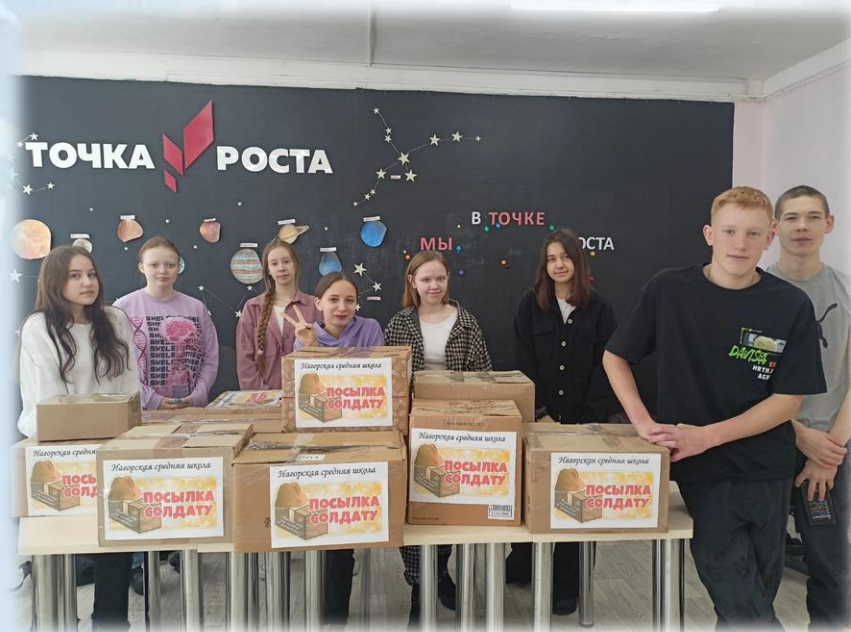
Акция «Посылка солдату»

В преддверии Дня защитника Отечества наша школа приняла активное участие в патриотических акциях «Блиндажная свеча», «Посылка солдату». «Письмо солдату». Все изготовленные свечи, собранные посылки и написанные письма отправятся участникам СВО.