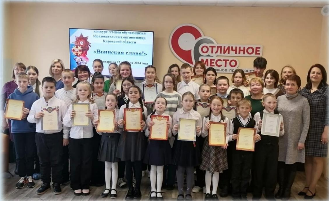
Участники районного конкурса чтецов «Воинская слава»

30 января для обучающихся общеобразовательных учреждений Нагорского района прошёл районный конкурс чтецов «Воинская слава».