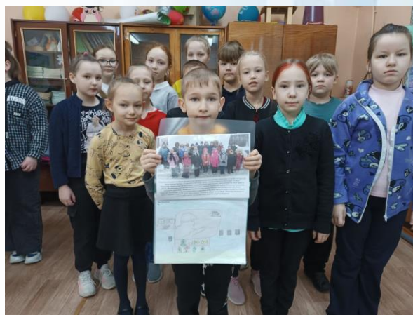
Ученики 3 «а» класса с альбомом-хранителем памятного места

После экскурсии ученики 3 «а» класса создали рисунки памятника, которые поместили в общий альбом, приложив подробное описание памятного места. Теперь этот альбом станет для ребят хранителем памятного места и ценным источником информации для будущих поколений!