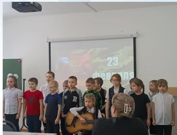
Концерт к Дню защитника Отечества