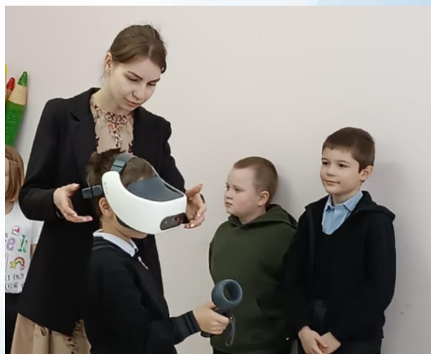
День российской науки во 2 «а» классе