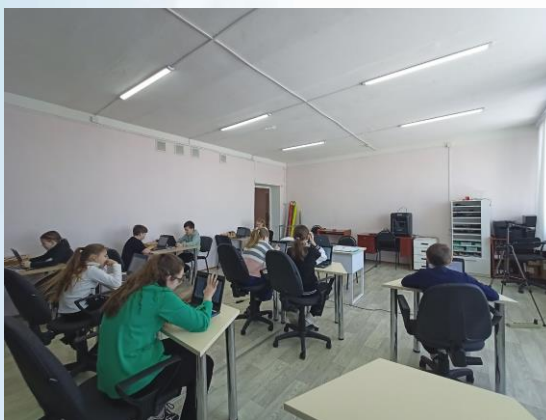
Участники отборочного этапа VI окружного блиц-турнира по шахматам

Всего участниками было сыграно 7 туров по швейцарской системе с ограничением времени по 7 минут каждому шахматисту на один тур.