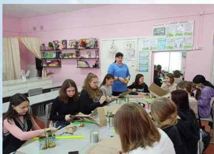
Акция «Блиндажная свеча»