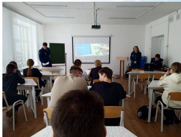
Профориентационная встреча учеников 10 и 11 класса с выпускниками Воронежского института ФСИН России

В ходе встречи учащимся 10 и 11 классов был продемонстрирован видеоролик об институте, возможности поступления в данное учебное заведение. Также ученикам рассказали о многих аспектах службы в уголовно-исполнительной системе.