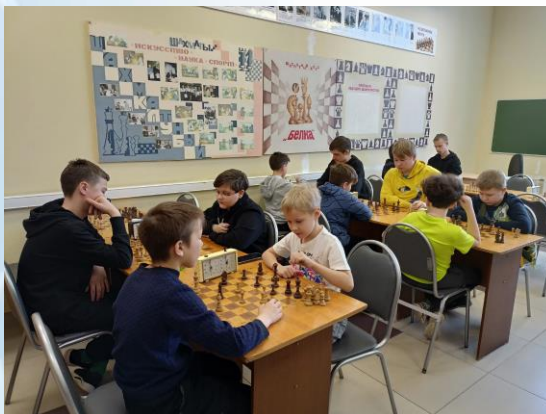
Юноши- участники основного этапа VI окружного блиц-турнира по шахматам

18 февраля обучающиеся, прошедшие отборочный этап турнира приняли участие в основном этапе соревнований. Проходил основной этап турнира в г. Слободском на базе МБУ ДК "Паруса".