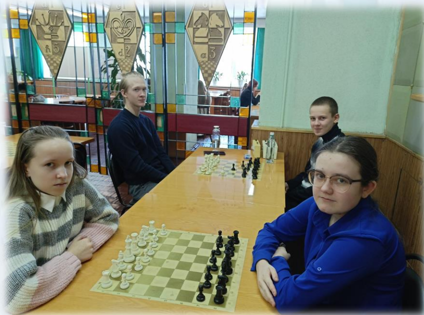
Команда участников областной спартакиады по шахматам из Нагорского района

С 13 по 17 февраля в шахматном клубе г. Кирова «Вятская ладья» проходила областная спартакиада по шахматам среди учащихся Кировской области.