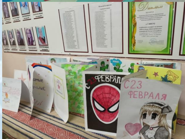
Подарки к Дню защитника Отечества