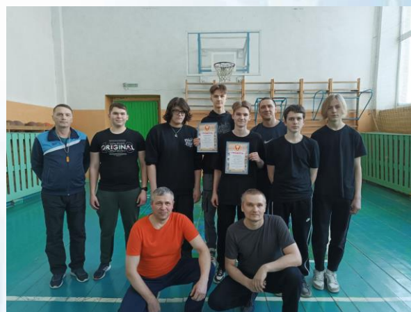
Соревнования по волейболу

Также в этот день состоялись соревнования по волейболу между командой родителей «Богатыри» и командой юношей из 9 «б» класса «Орлы». Победу на соревнованиях одержала команда «Богатыри».