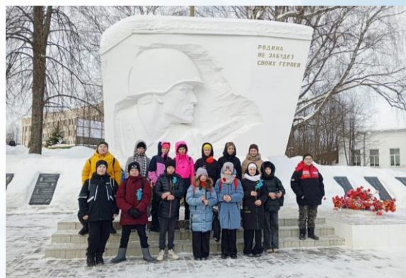
Ученики 6 «а» класса у памятника-монумента погибшим воинам в годы Великой Отечественной войны

Ученики 6 «а» класса возложили к памятнику цветы, после чего создали и провели опрос в социальной сети ВКонтакте, связанный с мемориальным местом и интересным фактами о нём.