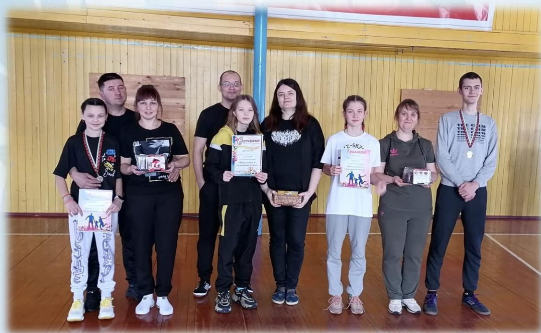
Участники спортивного мероприятия «Папа, мама, я – спортивная семья!»

Здоровый образ жизни должны вести все члены семьи. Ведь родители для своих детей являются примером для подражания.