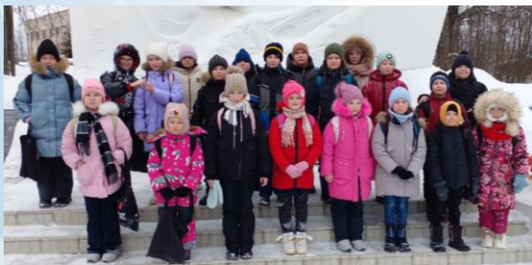
Ученики 3 «а» класса у памятника-монумента погибшим воинам в годы Великой Отечественной войны

Школьники посетили памятник-монумент погибшим воинам в годы Великой Отечественной войны.