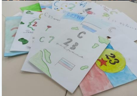
Акция «Письмо солдату»

Выражаем огромную благодарность за участие в акциях всем ученикам, учителям, работникам школы и родителям!