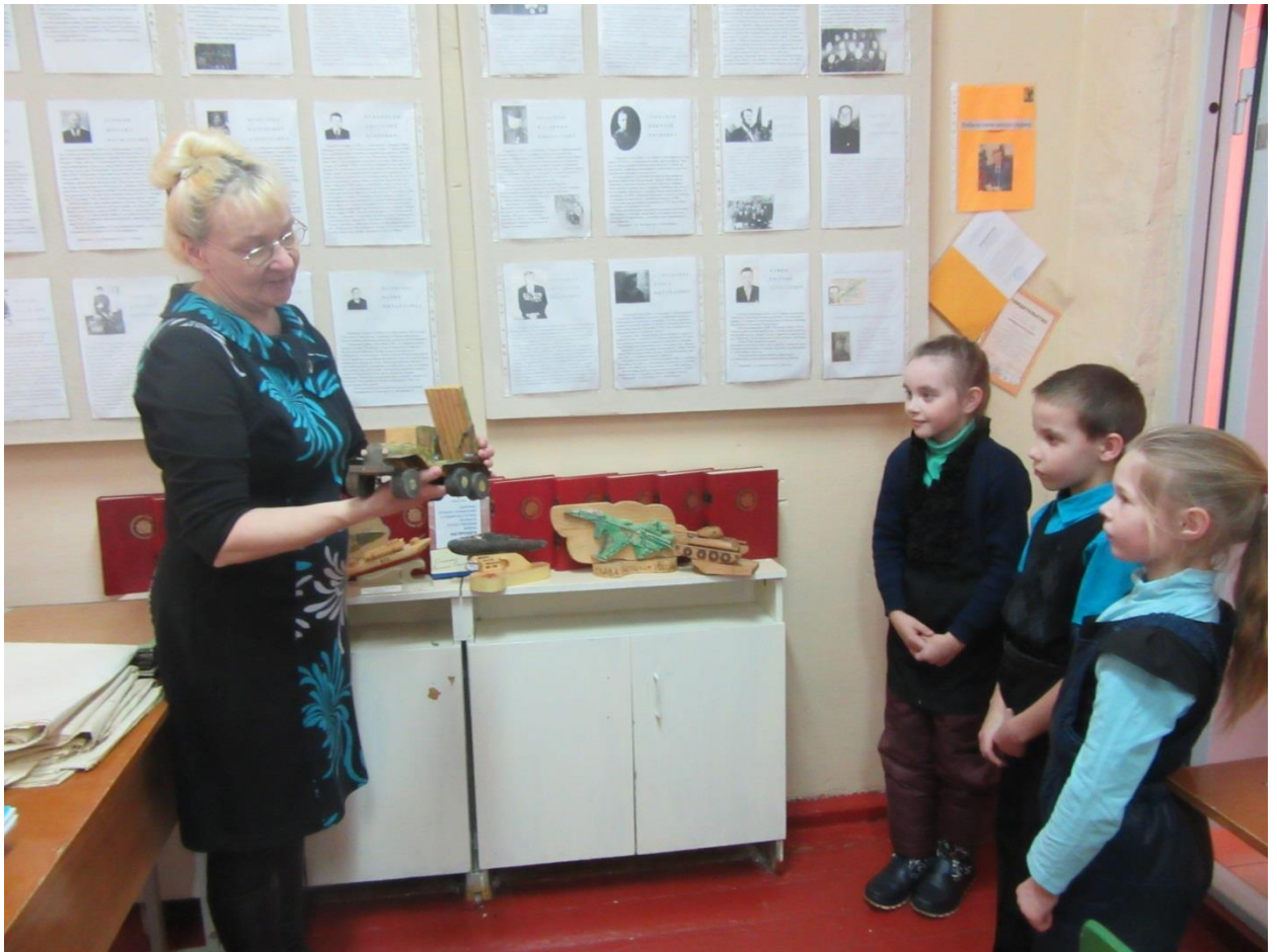
Тематическая экскурсия для второклассников (март 2018 г)