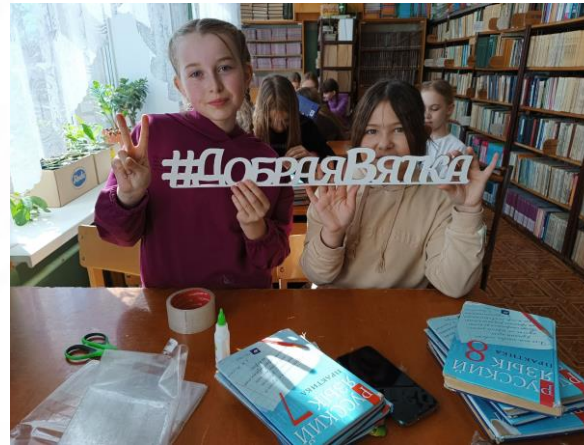
Акция «К книгам с любовью»

Ученики 5 «а» класса поучаствовали в акции «К книгам с любовью», подклеили книги школьной библиотеки.