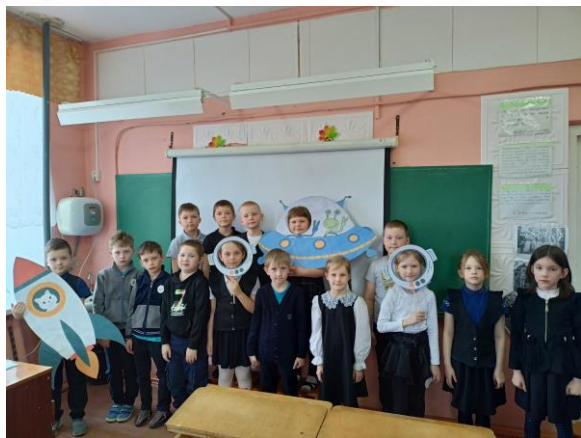
Космический урок в 1 «а» классе

В честь приближающегося Дня Космонавтики 10 апреля для учеников 1 «а» класса прошёл «Космический урок». На нём ребята узнали много нового о великих космонавтах, о планетах Солнечной системы, посмотрели мультфильм о космосе, поучаствовали в викторине и потанцевали вместе с космонавтами.