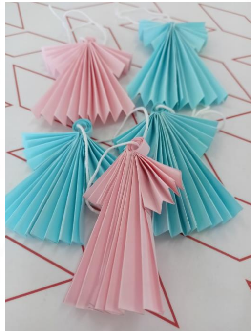
Акция «В кругу друзей»

Для учеников 7 «в» класса прошла акция «В кругу друзей», на которой ребята научились создавать ангелочков из бумаги.