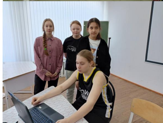
Команды участников игры «Космическая одиссея»