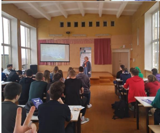
Профориентационное собрание для обучающихся 9-11 классов