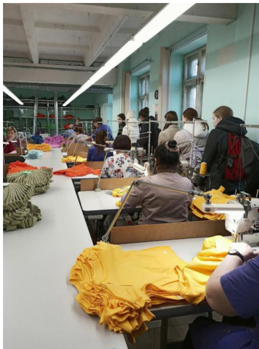
Девочки 9 «а» класса на экскурсии в швейном цехе ООО «Клевер»

Девочки 9 «а» класса посетили швейный цех ООО «Клевер», где встретились с мастером производства, познакомились с выпускаемой продукцией, смогли задать интересующие вопросы по организации процесса работы, а также получения профессии технолога и швеи.