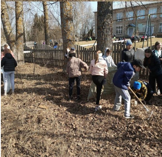
Уборка территории вокруг начальной школы