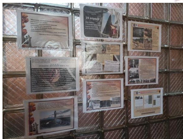
Стенд, посвящённый памятной дате

Также школьники приняли участие в акции «Письмо солдату». В письмах ученики выразили своё личное отношение к преступлениям нацистов, а также написали слова поддержки и благодарности нашим защитникам.