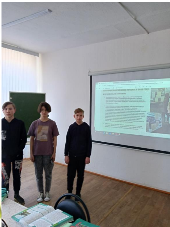
Урок «Без срока давности» в 7 «б» классе

Ученики 8 «в» класса оформили в школе стенд, посвящённый памятной дате.