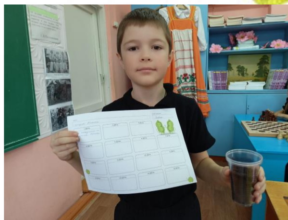
Занятие «Космический грунт» в 1 «а» классе

Своим новым друзьям ребята придумали забавные имена!