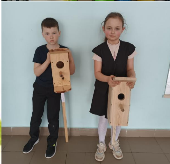
Акции марафона «Добрая Вятка»

Ученики 5 «а» класса поучаствовали в акции «К книгам с любовью», подклеили книги школьной библиотеки.