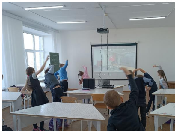
Спортивная зарядка во 2 «б» классе

5 апреля для учеников 3 «б» и 2 «б» класса были проведены весёлые спортивные зарядки.