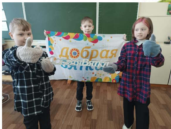
Мастер-классы на понимание людей с ОВЗ