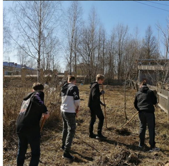
Уборка территории вокруг школы старшекласниками

Все дружно наводили порядок: собирали мусор, старые ветви деревьев, сгребали прошлогоднюю листву и траву, приводили в порядок цветочные клумбы.