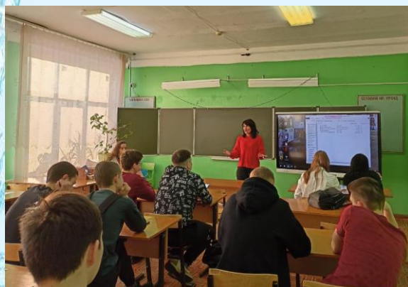
Профориентационная встреча с учениками 11 класса

1 и 2 февраля для учеников 9-11 классов прошли профориентационные встречи. Рассказать о своих учебных заведениях к школьникам приехали представители Пермской государственной фармацевтической академии, а также представители из Вятского государственного агротехнологического университета.