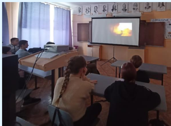
Просмотр фильма «Великая война. Сталинград» в 8 «а» классе

Обучающиеся 8 «а» класса посмотрели документальный фильм о событиях Великой Отечественной войны «Великая война. Сталинград».