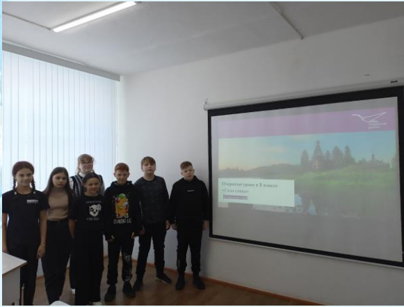
Открытый урок «Сила слова» в 5 «б» классе

В честь праздничной даты 20 февраля в 5 «б» классе прошёл открытый урок «Сила слова».