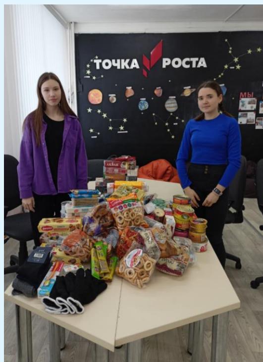
Сортировка и упаковка 2-ой партии продуктов, собранных для военнослужащих

В красочных коробках, оформленных детскими руками, печенье, конфеты, чай, кофе и много других сладких подарков.