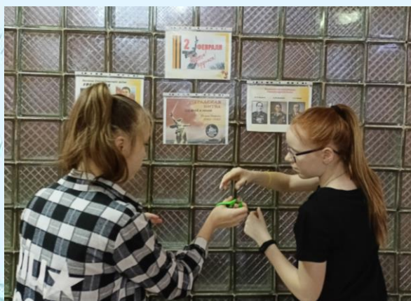
Оформление информационного стенда к Дню победы в Сталинградской битве

Ученицы 8 «в» класса помогли оформить информационный стенд.