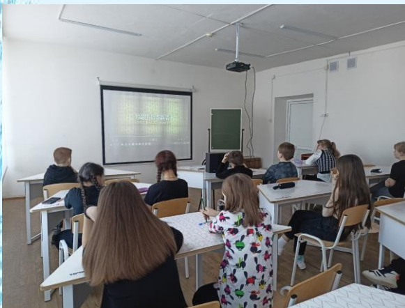
Просмотр видеороликов об истории становления современного языка

Ребята на уроке побеседовали о том, для чего всем нужен язык и для чего нужно быть грамотным. Посмотрели видеоролики об истории появления и становления современного русского языка, вспомнили народные пословицы, объяснили их смысл.