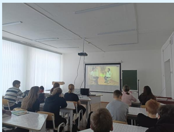
Урок мужества «Босоногий гарнизон» в 9 «а» классе

В девятых классах прошли онлайн уроки мужества «Босоногий гарнизон». На них ученики узнали об оккупации хутора, о юных героях, участниках Сталинградской битвы.