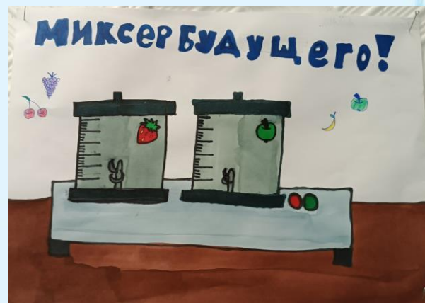
Работа конкурса рисунков «Это нам надо!»

Обучающиеся начальной школы приняли участие в конкурсе рисунков «Это нам надо». Ученики придумали, что они могли бы нового привнести в российскую науку и изобразили это в своих рисунках.