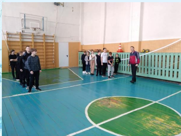
Весёлые старты в 5-ых классах

20 февраля в спортивном зале школы для обучающихся 5 классов состоялся спортивный праздник «Веселые старты», посвященный дню защитников Отечества.