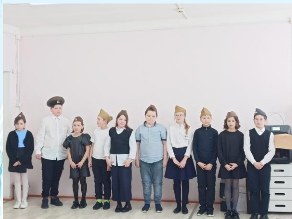
Поздравление от учеников 4 «а» класса

К празднику в нашей школе старательно готовились! В преддверии Дня защитника Отечества ученицы 7 «б» класса оформили в школе поздравительный стенд. Девочки вместе с классными руководителями поздравили мальчишек. Мужчин нашей школы поздравили с праздником учителя, директор, а также ученики 2 «б» класса, подготовив поздравительные открытки и ученики 4 «а» класса, прочитав стихотворения и исполнив песню.