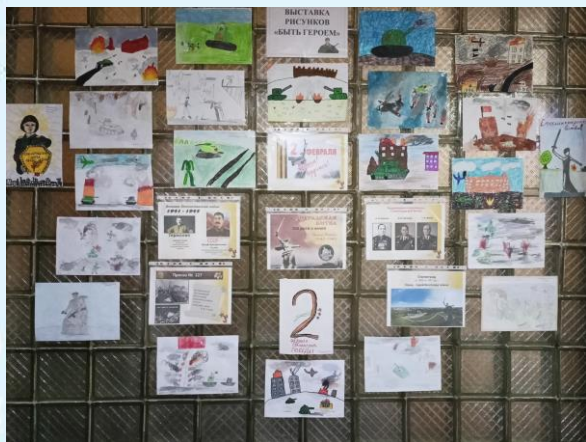
Выставка детских рисунков «Быть героем»

В этот день в нашей школе была оформлена выставка детских рисунков «Быть героем», приуроченная к дню победы в Сталинградской битве. Творческие работы выполнили ученики 1-4 классов.