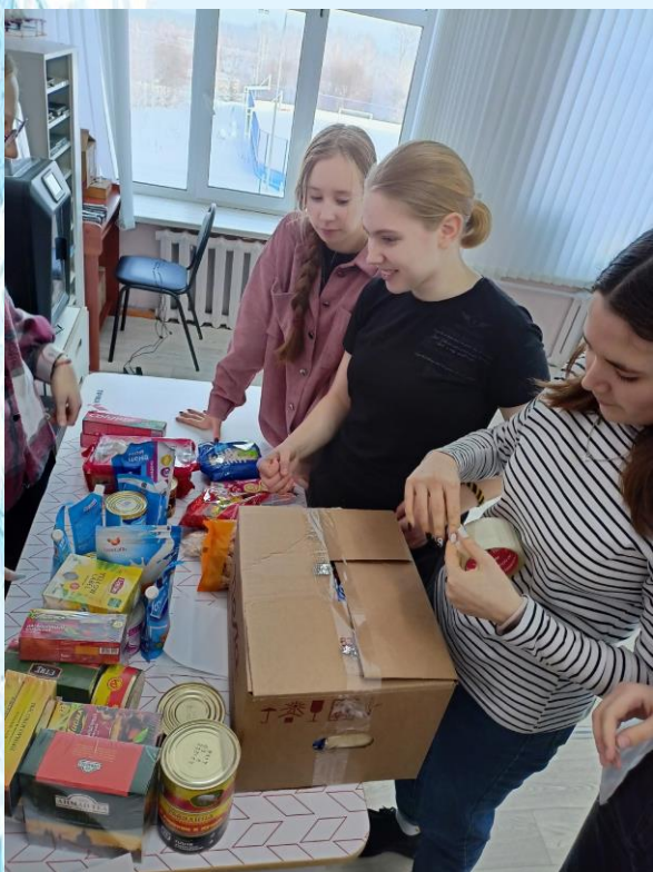
Сортировка и упаковка 1-ой партии продуктов, собранных для военнослужащих

Также нашим военным отправятся детские рисунки и письма с поздравлениями. Тёплые слова, которые будут написаны в открытках, сделанных детскими руками поднимут боевой дух военнослужащим и помогут идти только вперёд и одержать победу.