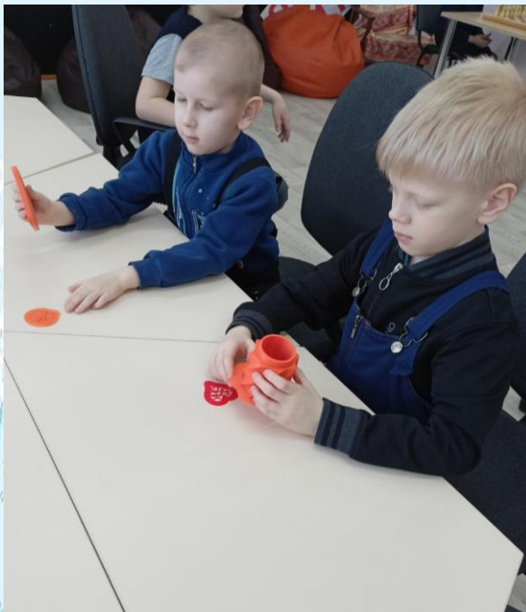
Экскурсия в «Точку Роста» учеников 1 «б» класса

На занятии ученики вспомнили о великих русских ученых, их открытиях и изобретениях, без которых нельзя представить современную жизнь. Ребятам рассказали о возможностях центра и разнообразии кружков. Они с большим интересом задавали вопросы, а в конце занятия побывали в мире виртуальной реальности.