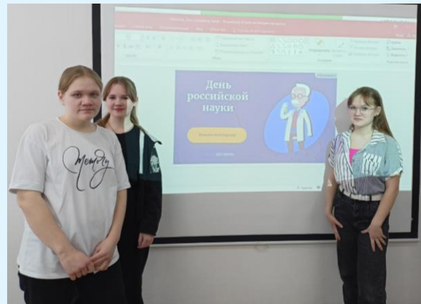
Интеллектуальная викторина в 8 «а» классе

8 февраля для учеников 8 «а» и 8 «б» класса прошли интеллектуальные викторины. Посмотрев видеоролик о выдающихся деятелях науки и их вкладе в развитие нашей страны, ребята в командах отвечали на вопросы. В ходе игры ребята получили массу положительных эмоций и узнали много интересного.