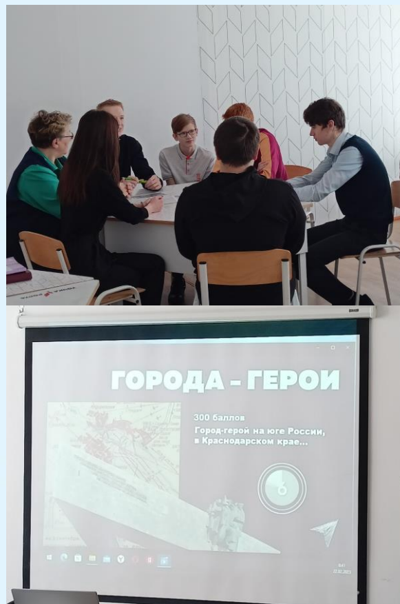
Видеоквиз в 10 классе

В 10 классе в честь праздника прошёл видеоквиз. Обучающиеся, работая в командах, отвечали на вопросы разных категорий: «Города-герои», «Герои на все времена», «Былинные богатыри», «Животные на войне», «Даты великих событий». Не смотря на сложность некоторых заданий, ученики успешно с ними справились! Молодцы!