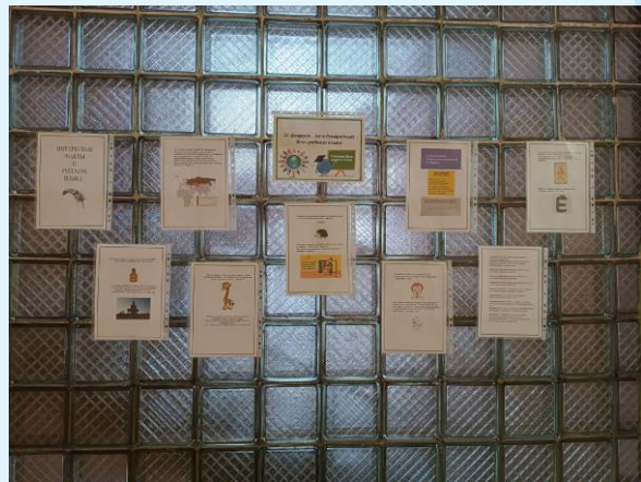
Стенд «Интересные факты о русском языке»

Ученицы 7 «а» класса оформили стенд, посвящённый Международному дню родного языка.