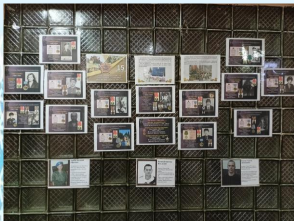
Стенд, посвящённый россиянам, исполнявшим служебный долг за пределами Отечества

В честь памятной даты в нашей школе был оформлен стенд «Время выбрало нас».