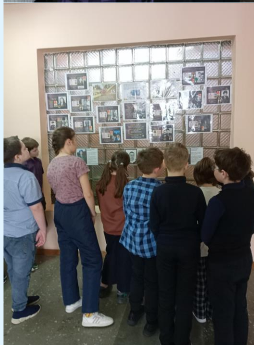
Уроки мужества в 4-ых классах

15 февраля традиционно во многих российских городах проходят торжественные и памятные мероприятия, митинги и акции, с участием ветеранов боевых действий, представителей власти, общественности и учреждений военно-патриотического воспитания молодежи.