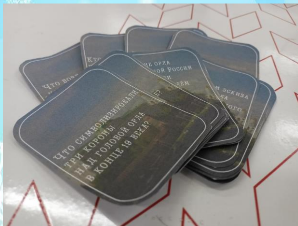
Аукцион знаний «Мой герб»

В конце урока ученики поучаствовали в аукционе знаний «Мой герб»: в парах вытягивали карточки с вопросами о гербе и отвечали на них.