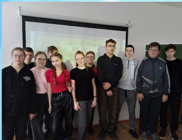
Урок «Из истории Государственного герба в 8 «в» классе

В честь этого дня ученики 8 «в» класса посетили исторический урок «Из истории Государственного герба». На нём ребята узнали, какие изменения происходили с внешним видом герба с периода его первого появления в Византийской империи до сегодняшнего дня и с чем были связаны эти изменения.