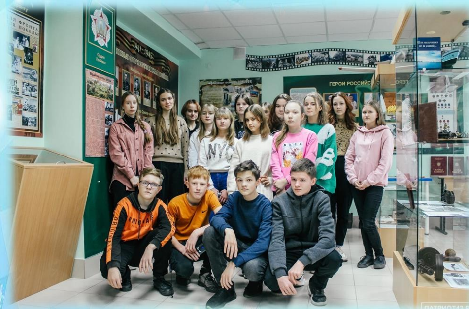
Ученики Нагорской школы в центре «Патриот»

29 ноября учащиеся Нагорской школы посетили выставочный центр системы воспитания и образования Кировской области. В центре «Патриот» ребята побывали на трёх локациях.