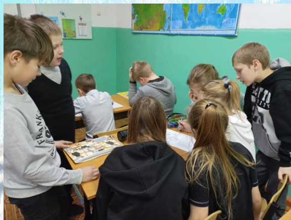
Игра по изобразительному искусству в 5-ых классах