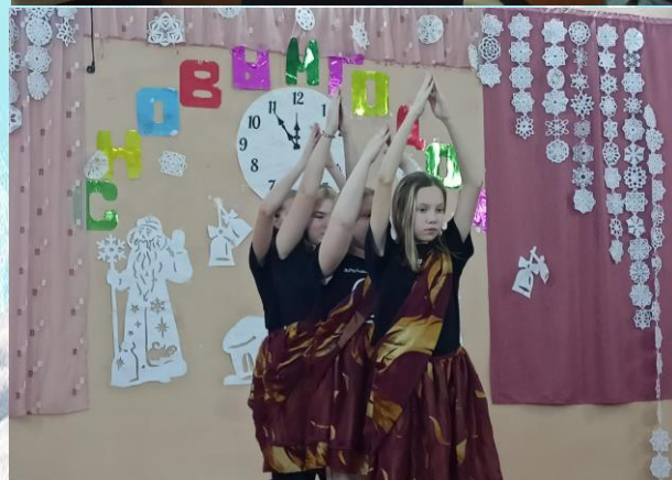
Новогодняя ёлка в 5-6 классах

Праздник прошёл весело и интересно! Спасибо учащимся, педагогам и всем, кто организовал замечательный праздник!