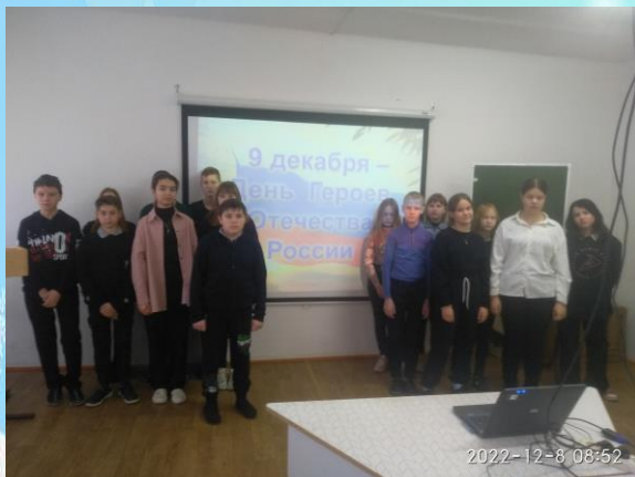
Урок Мужества в 6 «б» классе