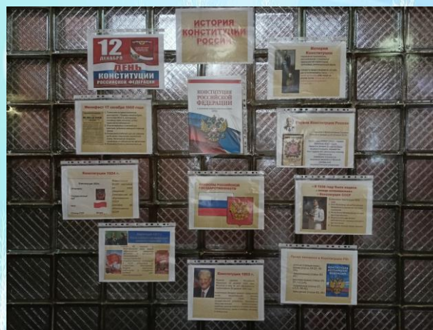
Стенд «История Конституции России»

В честь Дня Конституции РФ в нашей школе прошли разговоры о важном, на которых классные руководители и ученики беседовали о том, почему Конституция является самым важным в жизни каждого документом. Также в школе учениками 10 класса был оформлен стенд «История Конституции России».