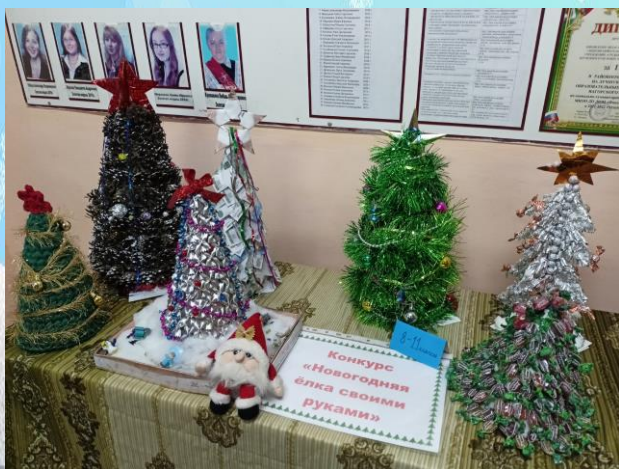
Конкурс «Новогодняя ёлка своими руками»

В этом году по традиции прошёл предновогодний творческий конкурс. Назывался он «Новогодние ёлки своими руками». Ученики из каждого класса выполняли сказочные ёлочки из различных материалов. Выставка поделок была организована на 1 этаже школы.