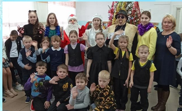
Новогодняя ёлка в начальной школе

Для учеников начальной школы прошли Новогодние Ёлки. Сказочные герои с Дедом Морозом, Снегурочкой и символами 2023 года поздравили ребят с наступающим Новым Годом, провели игры, вручили грамоты и подарки.