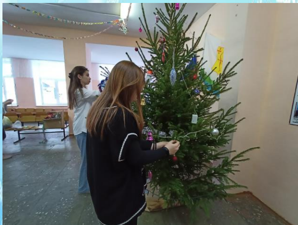
6 «б» класс украшает новогоднюю ёлку

Праздничное настроение постепенно заполняет школу. Ребята украшают школьное фойе, коридоры, окна, кабинеты. Около здания школы, в фойе и в столовой появились и засветились огнями нарядные ёлочки. Их тоже старались украшать наши ученики. В школьной столовой оформили сцену. Сейчас праздничное настроение царит везде!