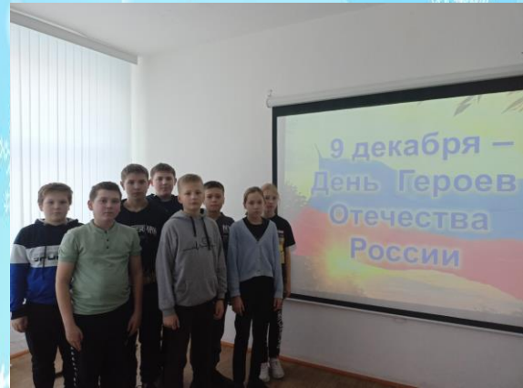
Урок Мужества в 6 «а» классе

9 декабря в 4 «б» классе прошло занятие «9 декабря – День Героев Отечества». Ребята узнали о героях нашей страны, их подвигах, познакомились с наградами-орденами, в конце мероприятия заполнили карточки с заданиями.