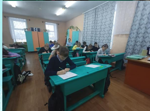
Занятие «День Героев Отечества» в 4 «б» классе

День Героев Отечества – важная для нас памятная дата, которая является продолжением исторических традиций и способом сохранения памяти о том, какие подвиги были совершены героями нашей страны.