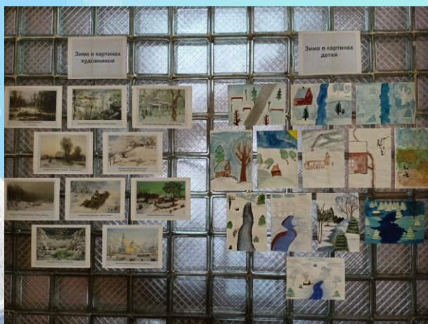
Выставка рисунков «Зима в картинах»

В честь Международного дня художника в нашей школе прошли тематические мероприятия. В школе была оформлена живая выставка на тему «Зима в картинах». На стенде были представлены работы известных художников, а также работы учеников нашей школы. Так, ребята смогли побывать на одной выставочной стене с выдающимися художниками.