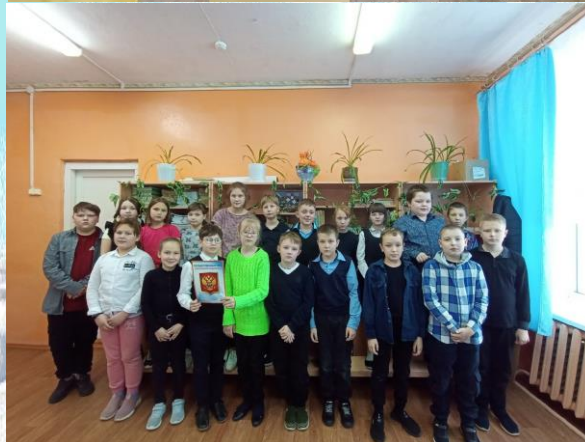
Фото-челлендж «Герб Российской Федерации»