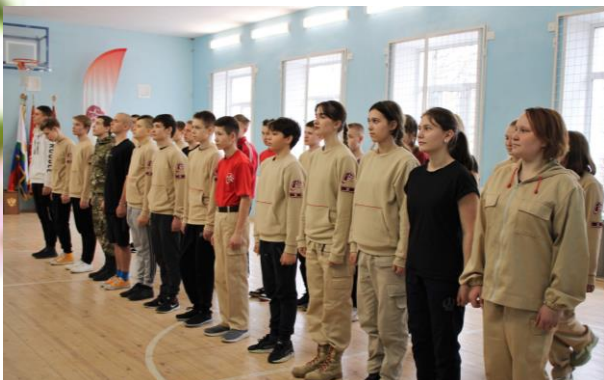
Участники обучающего семинара «Школа командиров»

Завершился первый этап обучающего семинара Регионального отделения ВВПОД «ЮНАРМИЯ» Кировской области «Школа командиров», в котором приняли участие ученики и Нагорской школы.