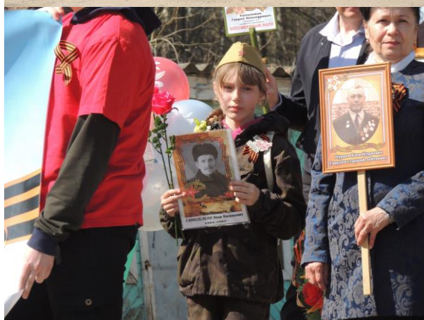
Акция «Бессмертный полк»

Это было так давно, но и нынче не забылось... Невозможно забыть то, что принесло горе всему человечеству, что унесло миллионы жизней, что отозвалось болью в сердце каждого... Великая Отечественная война... Чем дальше уходит от нас это событие, тем меньше остается в живых тех, кого мы называем солдатами Победы. И тем меньше, к сожалению, мы помним об этих героях. А они порой живут рядом с нами.