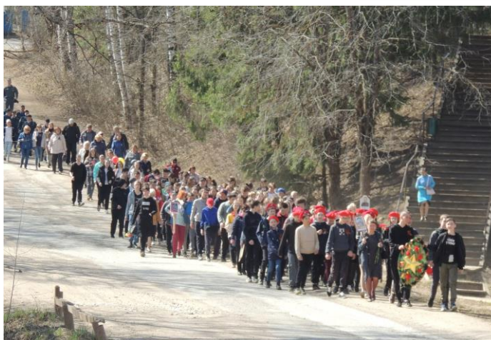
Участие в митинге, посвященном 77-ой годовщине Великой Победы