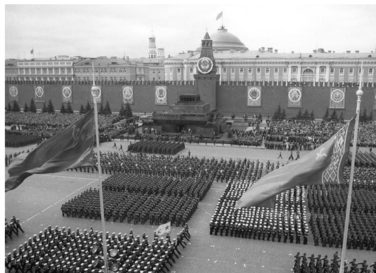
Парад Победы 9 мая 1945 г.