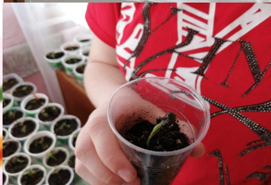
Посадка семян кедр