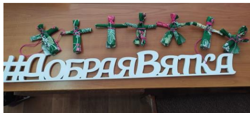
Куклы, изготовленные учениками 6 «в» класса

В 6 «в» классе прошёл мастер-класс по изготовлению народной куклы. Ребята познакомились с историей и традициями игрушечного ремесла, а также изготовили тряпичную куклу-кувадку.