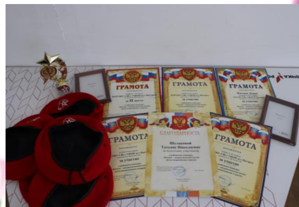
Награды за конкурс «Военно-патриотической песни»