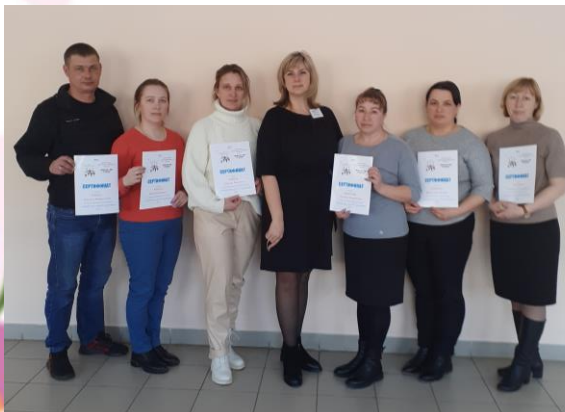
Участники акции «Единый день сдачи ЕГЭ родителями»

В конце мероприятия родителям вручили сертификаты участников акции.