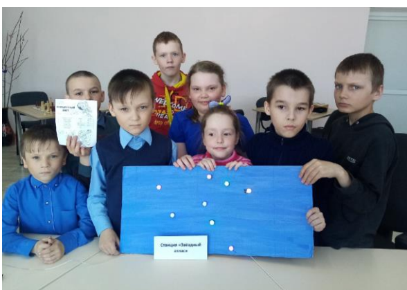
Станция «Звёздный атлас»

На станции «Кроссворд» ребята разгадывали различные космические объекты.