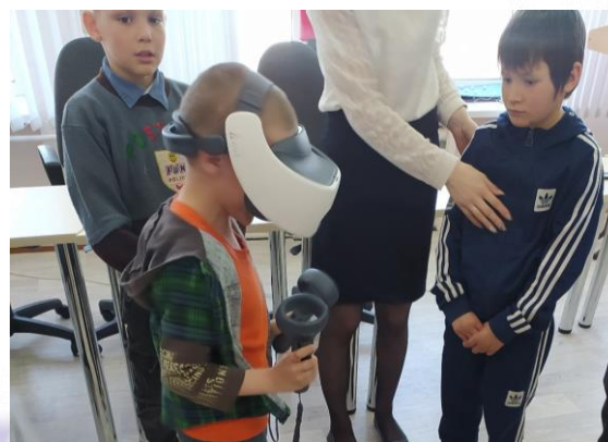
Космические игры в 3-D очках

После награждения ребята с удовольствием собирали роботов из лего, играли в шахматы, а также осваивали 3-D пространство с помощью очков виртуальной реальности.