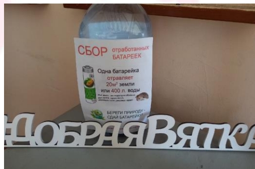
Сбор отработанных батареек

В 6 «в» классе прошёл мастер-класс по изготовлению народной куклы. Ребята познакомились с историей и традициями игрушечного ремесла, а также изготовили тряпичную куклу-кувадку.