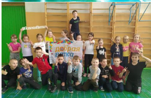
«Игры Вятского края»