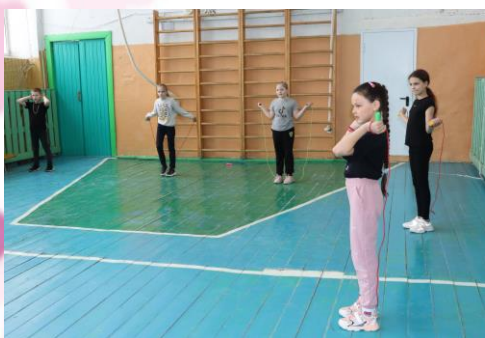
Акция «Прыгай на здоровье!»

6 апреля празднуется Международный день спорта. В честь праздника в нашей школе прошло несколько спортивных акций. Соревнования по прыжкам со скалкой (прыжки классические вперед). В акции «ПРЫГАЙ НА ЗДОРОВЬЕ!» приняли участие ребята из 6 «б» и 4 «б» класса.