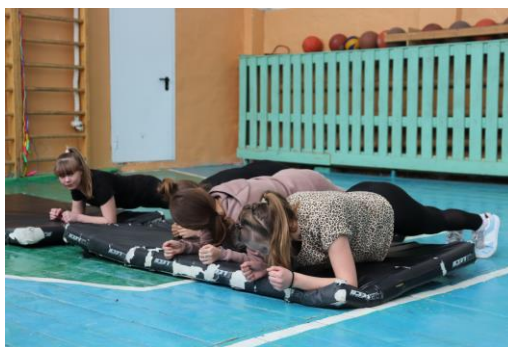
Чемпионат по планке

В 6 «б» и 4 «б» классах также прошёл чемпионат по планке. Ребята соревновались в том, кто больше продержит планку.