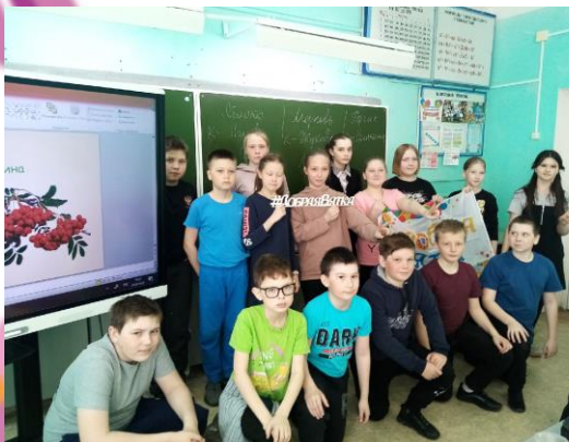
Игра «Питайся правильно» в 5 «а» классе

С целью формирования позитивного отношения к ЗОЖ в 5 «а» и 6 «б» классах прошло интерактивное занятие «Питайся правильно». В ходе игры ребята разделились на команды и, отвечая на вопросы о полезных и вредных продуктах питания, познакомились с принципами правильного питания.